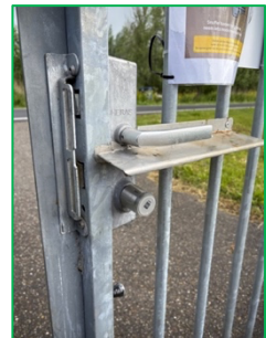
Foto: Binnenzijde linker poort

We willen iedereen erop attenderen om de toegangspoort goed op slot te draaien. Vaak openen we bij aankomst alleen het rechterdeel van de poort. Het op slot draaien gaat daarbij vaak goed. Maar bij het linkerdeel van de poort wordt dat vaak vergeten. Het linkerdeel is namelijk alleen van binnenuit op slot te draaien, zie bijgaande foto. Controleer ook of het goed op slot zit: kan de pin nog omhooggehaald worden? Dan zit de poort niet goed op slot! Vergeet dit dus niet want samen houden we Breeveld veilig.