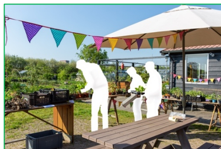
Herkenbare personen hebben toestemming gegeven voor publicatie Foto's: Quitama (tuin 31)